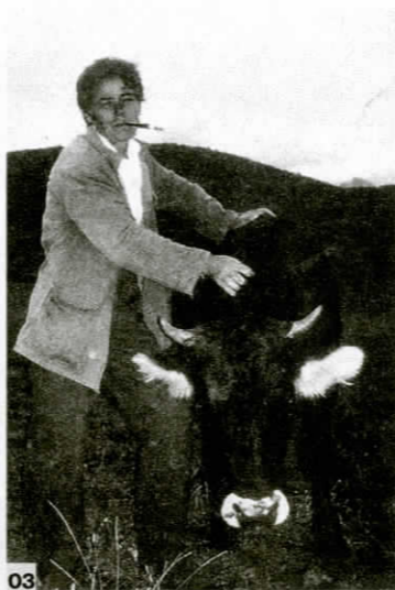
03 Haki, selo kraj Bajram Currija, sjeverna Albanija