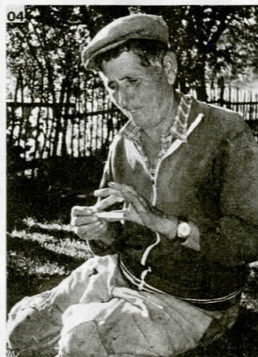
04 Shkurtan, selo kraj Bajram Currija, sjeverna Albanija