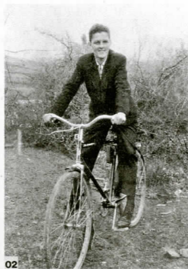
02 Stanica-Draga Marinković, Zaton, Bijelo Polje, Crna Gora